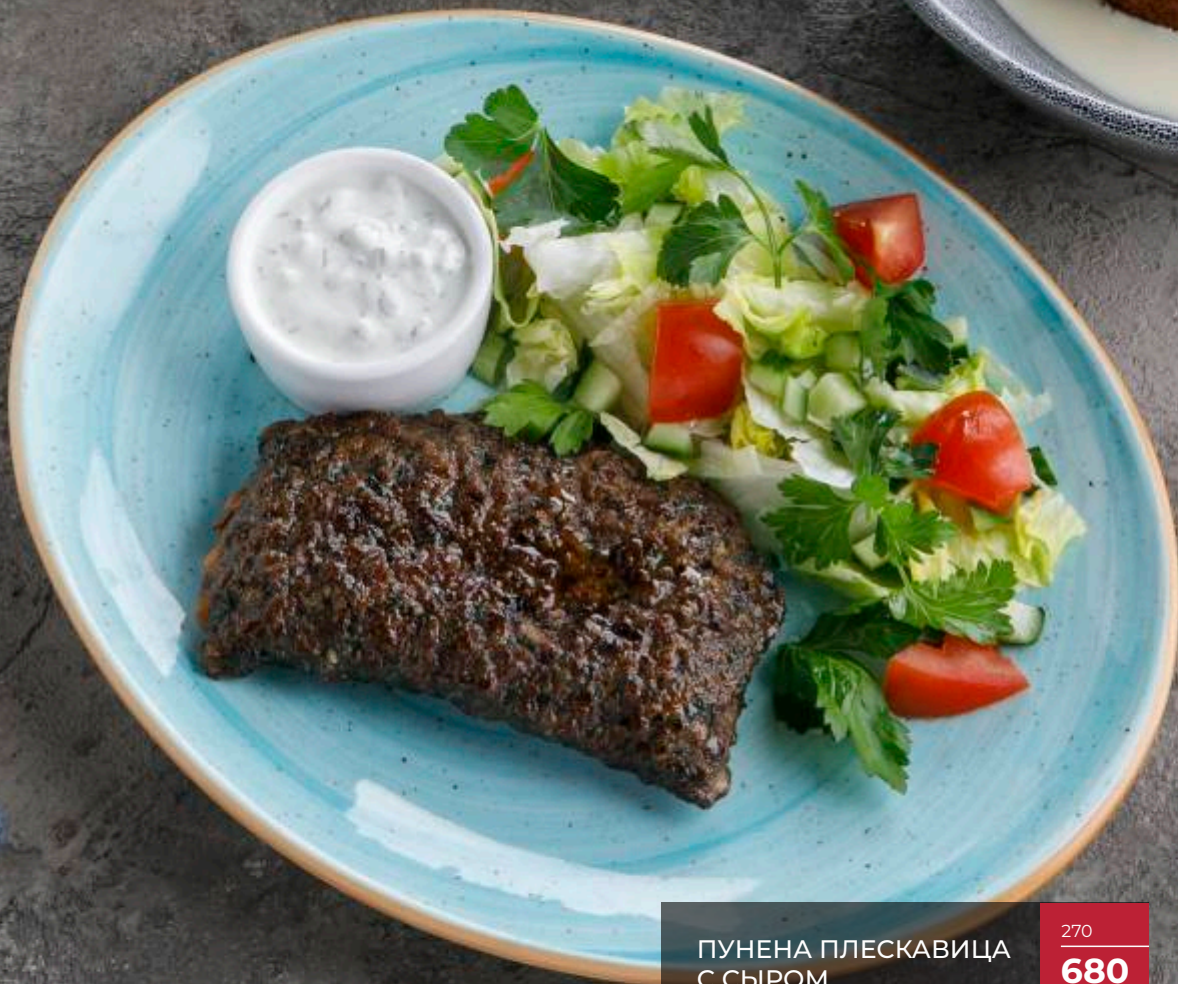
ПУНЕНА ПЛЕСКАВИЦА С СЫРОМ