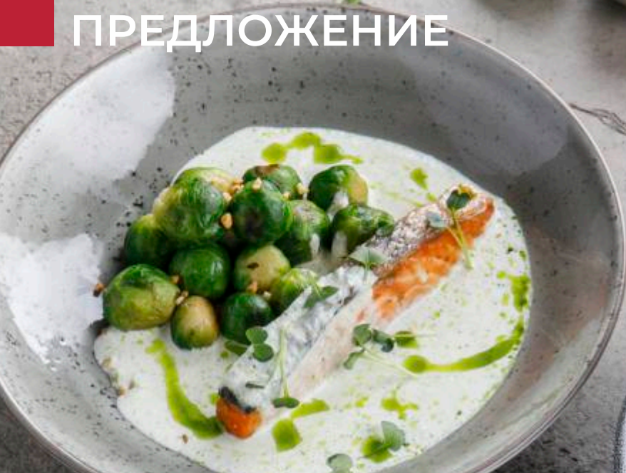
ЛОСОСЬ С БРЮССЕЛЬСКОЙ КАПУСТОЙ